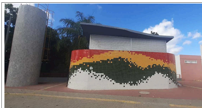
1.0 PRÉDIO PÚBLICO (BANHEIRO) DESATIVADO, LOCALIZADO A AVENIDA CARDOSO DE SÁ, ORLA - CENTRO.

SECRETARIA DE DESENVOLVIMENTO URBANO, HABITAÇÃO E SUSTENTABILIDADE