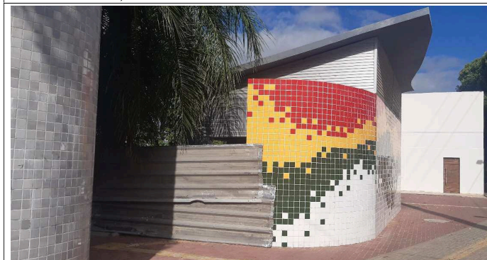
2.0 PRÉDIO PÚBLICO (BANHEIRO) DESATIVADO, LOCALIZADO A AVENIDA CARDOSO DE SÁ, ORLA - CENTRO.

AVENIDA DA INTEGRAÇÃO AYRTON SENNA, 948, DOM MALAN, PETROLINA/PE