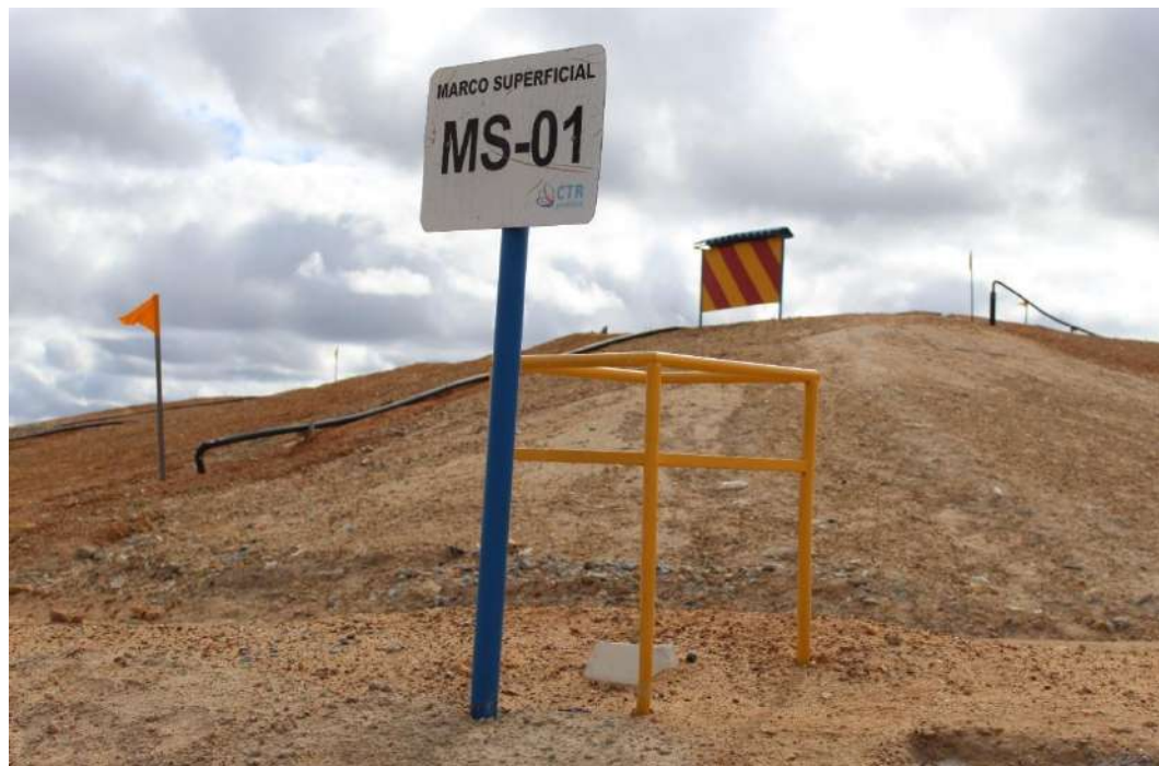
Foto 7 – Marco superficial para controle de recalques protegido com gradil metálico; bandeirola para identificação de poços de biogás inseridos no processo de geração de energia, e acima com listras amarelas e vermelhas a armadilha para controle de moscas.