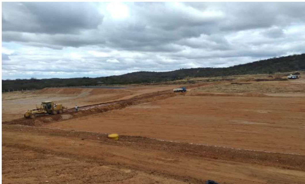
Foto 1–Terraplenagem para implantação do 8º avanço de célula no aterro Classe II, em julho de 2021.