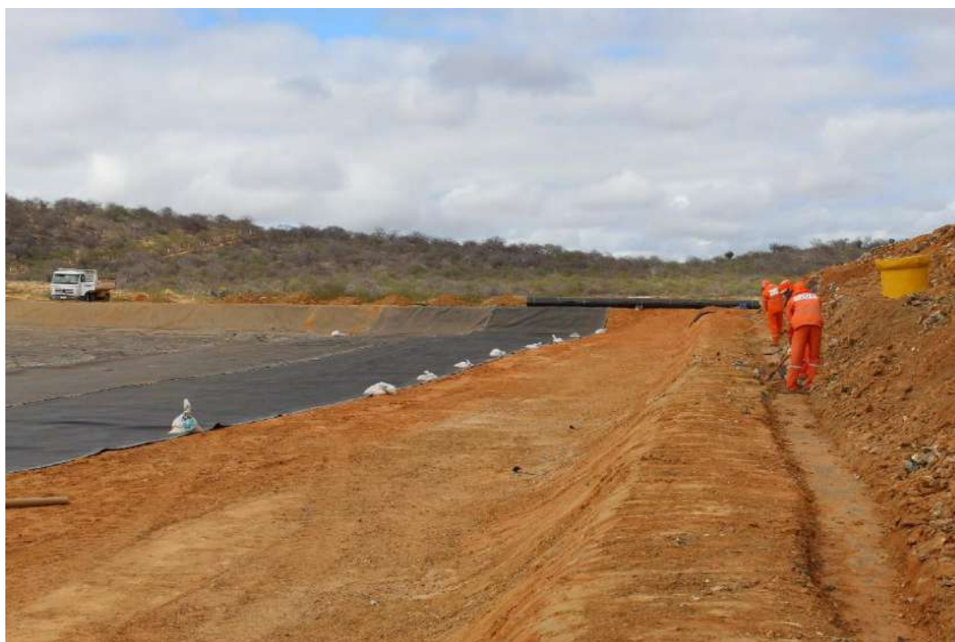
Foto 2 – Escavação manual para realização da emenda entre mantas de PEAD