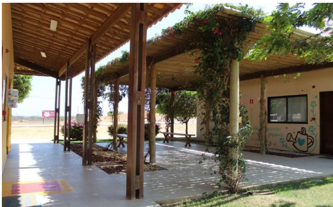
Foto 8 – Sala de educação ambiental e área de vivência da Nova CTR em novembro de 2021.