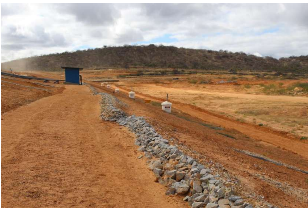
Foto 6 – Limitadores de drenagem pluvial nas bermas do aterro classe II. Ao fundo se observa a estação de regulação do sistema de biogás.