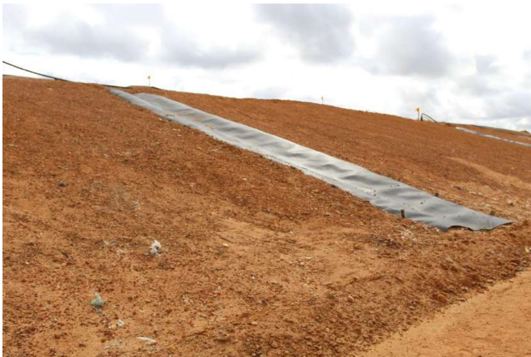
Foto 5 – Descidas de drenagem com aproveitamento de manta de PEAD aplicada sobre talude devidamente coberto e geometrizado.