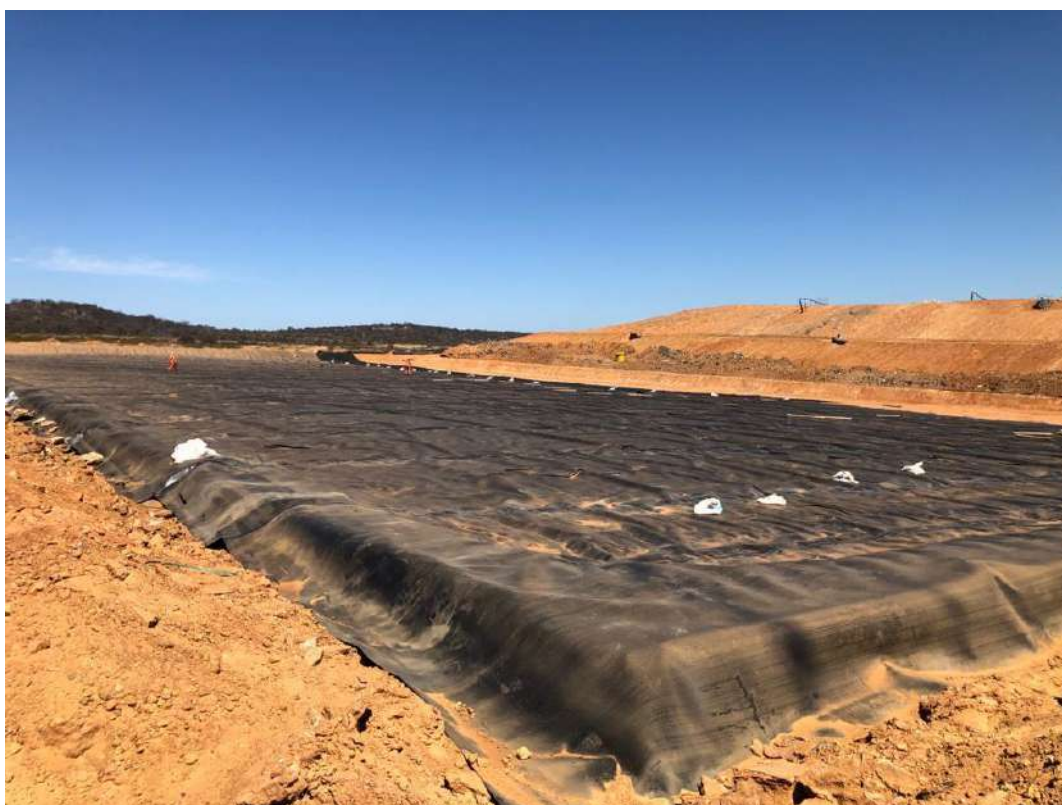
Foto 4 – Panorâmica do 8º avanço de célula do aterro classe II. Ao fundo se observa a célula do aterro Classe II.