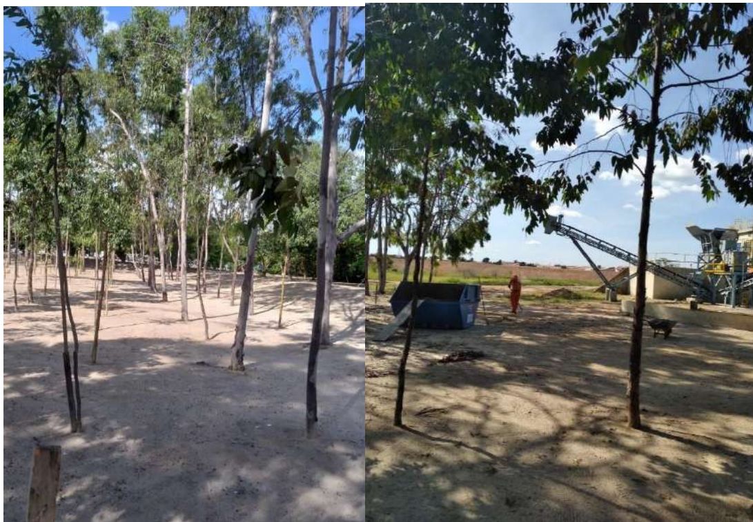
Foto 14 – Manutenção da cortina arbórea e da unidade de beneficiamento de entulho.