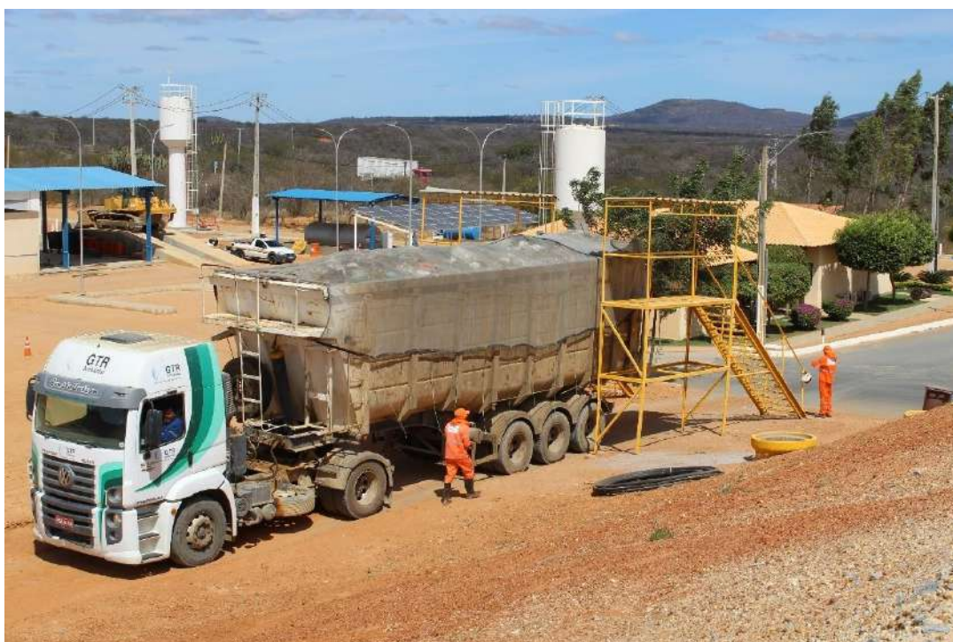
Foto 10 – Carreta posicionada para retirada de lona antes do acesso à frentede descarrego.