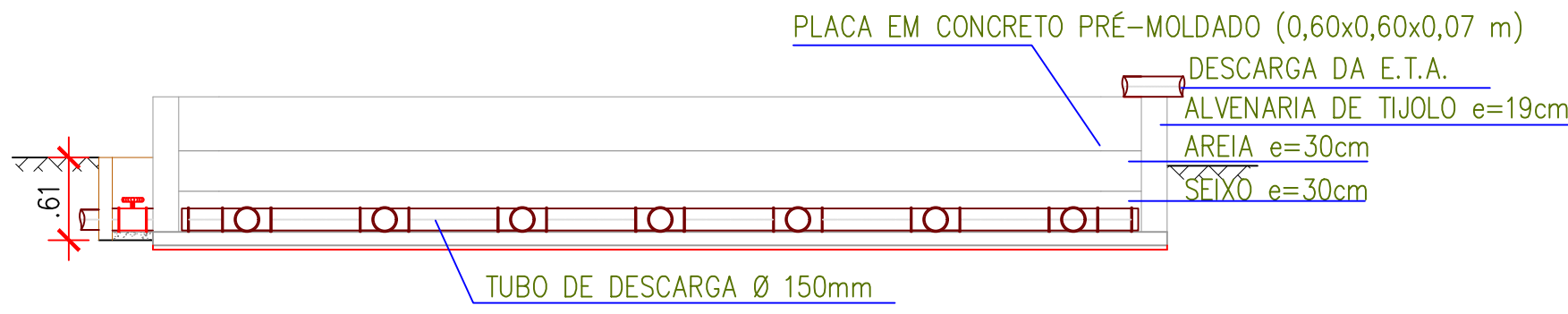
CORTE B-B ESC. 1/75