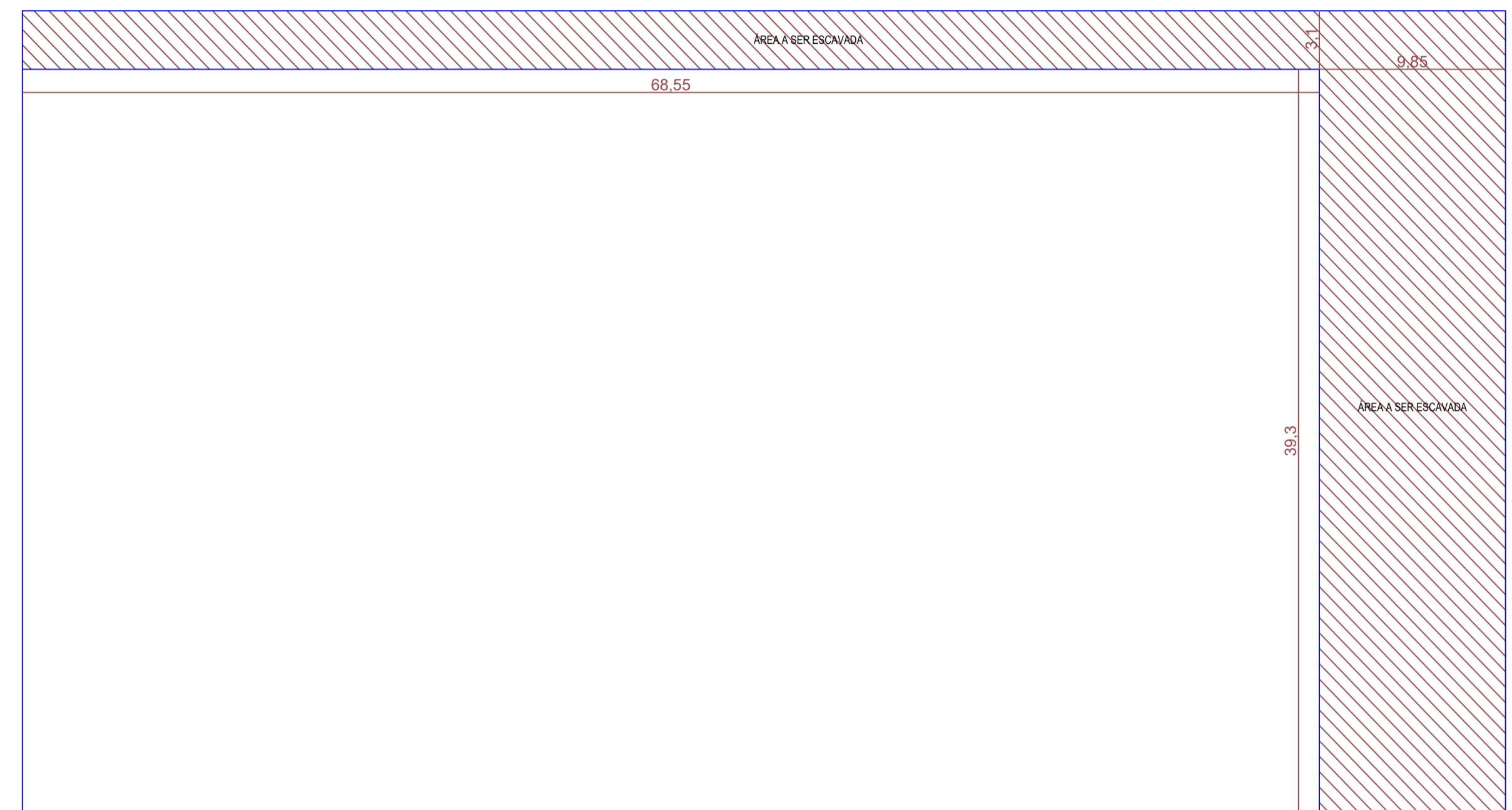
PLANTA BAIXA DA SITUAÇÃO ATUAL DA LAGOA FACULTATIVA ESC: 1:250