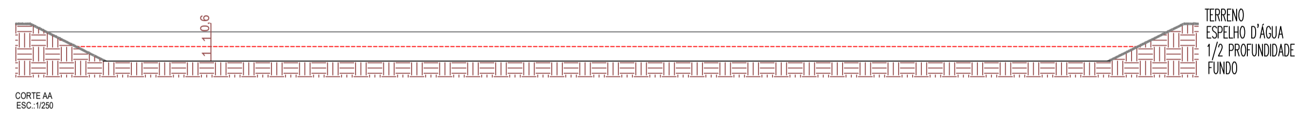
CORTE AA ESC: 1:250